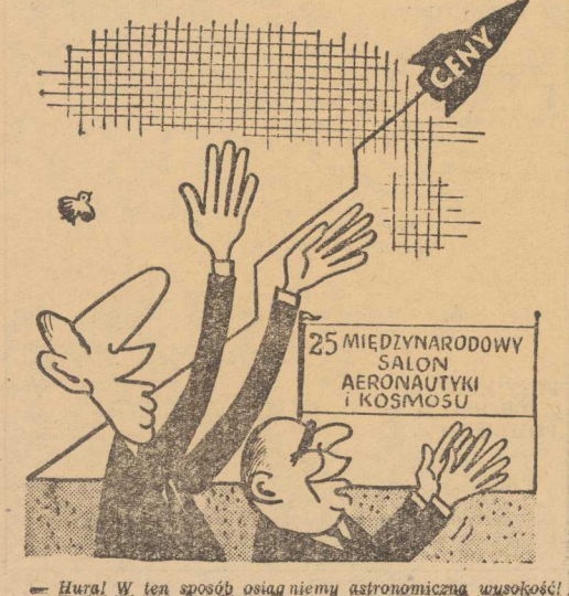
— Hurra! W ten sposób osiągniemy astronomiczną wysokość!