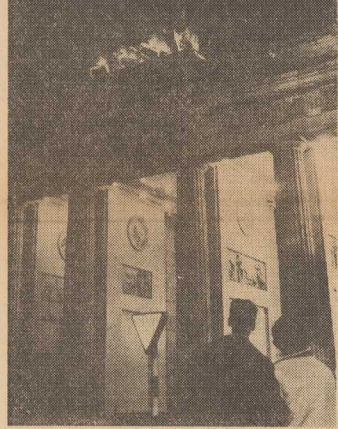
BRAMA BRANDENBURSKA — rzeźbie iluminowana — jest atrakcją turystyczną DEMOKRATYCZNEGO BERLINA.

NOWO ZBUDOWANY wieżowiec nad Sprewą cieszy się wielką popularnością berlińczyków, którzy tłumnie odwiedza ją znajdujące się w tym gmachu dwie restauracje.