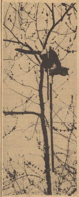
Do góry było łatwiej!

wano („DDT“ i inne preparaty). Muchy odporne na te preparaty, którego nawet najbardziej wadobójcze płyny już się nie „imają“.