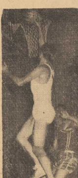
Trzecie miejsce w turnieju zajął Fogot, który w meczu z Politechniką zwyciężyła 57:34.