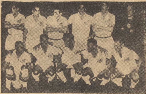
TEJ PRZYJEMNOŚCI nie możemy sobie odmówić. Zdjęcie najlepsze pikarskiej jedynostki...