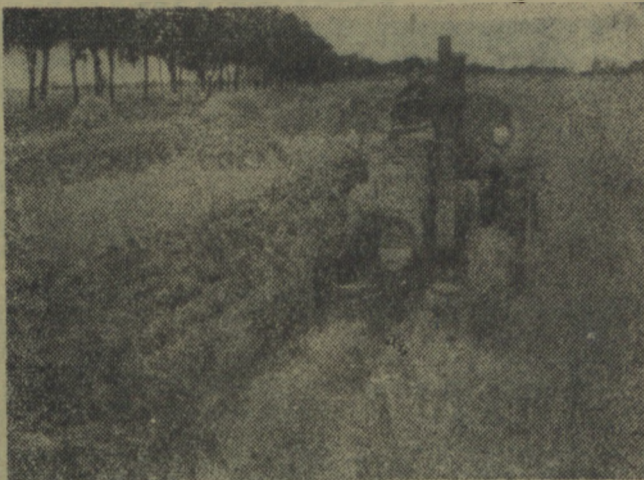
W gospodarstwie PGR Golewa na Żulawach bezpłodnie po sprzęcie rzepaku i zbót dokonują się podorywki i siewy poplonów.