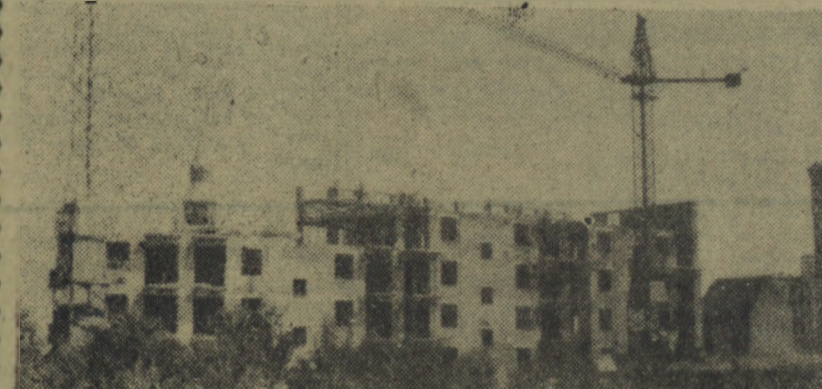
Na terenie Krakowa i Nowej Huty buduje się obecnie kilka osiedli mieszkaniowych o łącznej ilości 5439 izb.