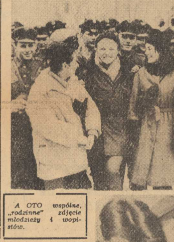
„A OTO wspólnie, „rodzinne” zdjęcie młodzieży i towarzyszy.

DUŻE zmiany zostaną poczynione w organizacji warsztatów zakładów usługowych. W roku ubiegłym zakładów w takich tradycyjnych branżach jak szewstwo i krawiectwo. W tym roku warsztatowe zakłady powstaną przede wszystkim w takich branżach jak naprawa sprzętu gospodarstwa domowego, usługi radiowe i telewizyjne itd. Fundacja powstanie w roku bieżącym 60 tzw. scentralizowanych zakładów usługowych, z których każdy zatrudni co najmniej 20 osób o raz posiadać będzie co najmniej 2 punkty przy jed. Około 90 zakładów