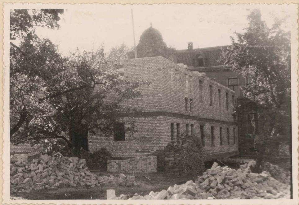
W budowie biurowiec Prez.PRN w Dębnie