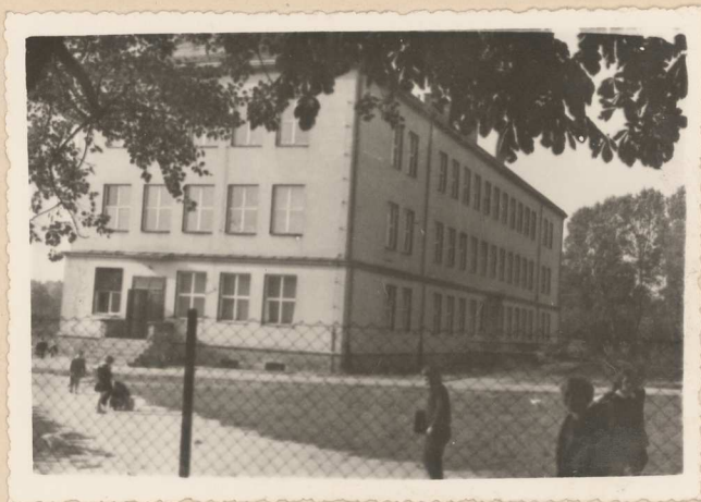
Dębno. Nowy budynek Szkoły Nr 1.