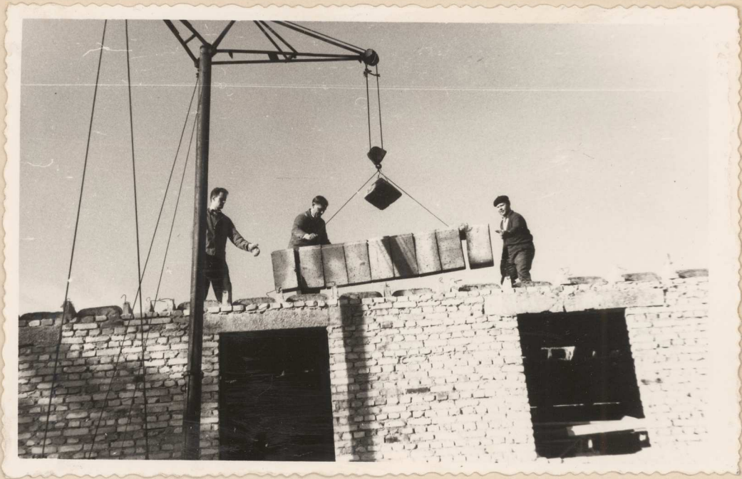
A oto przykład czynu społecznego. Na zdjęciach Przewodniczący Pre- zydium PRN w Dębnie inż. Eugeniusz Tomczak przy budowie biurowca.