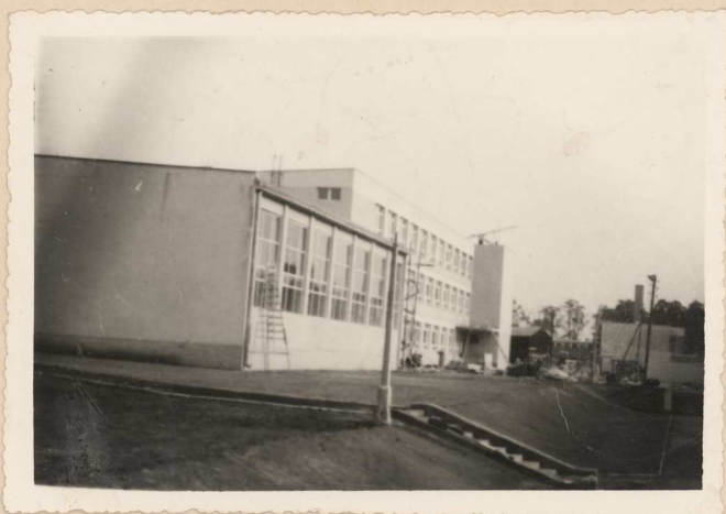
Chojna. Nowa Szkoła Rzemiosł Budowlanych.