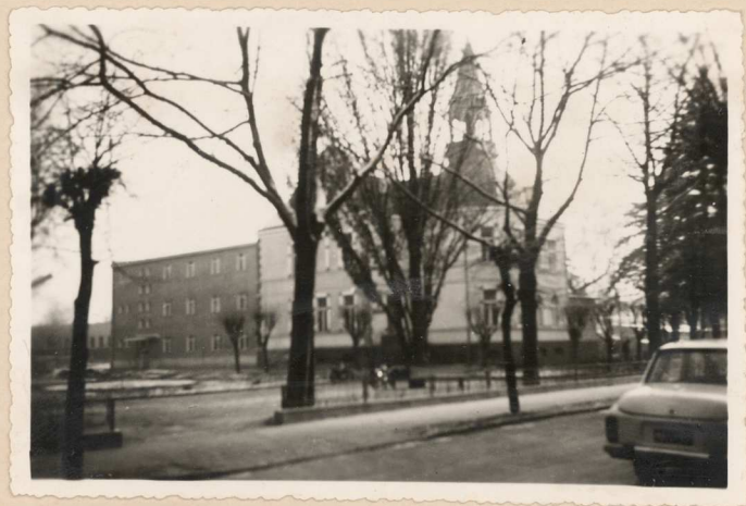
Dębno. W głębi nowy biurowiec Powiatowej Rady Narodowej