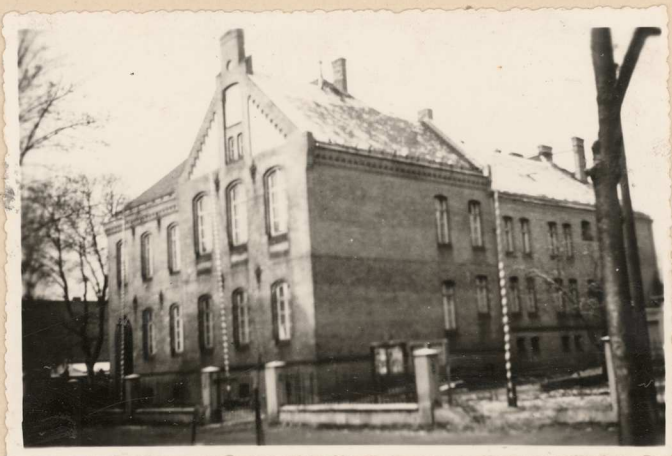
Dębno. Budynek internatu TeczNIKUM Ekonomicznego