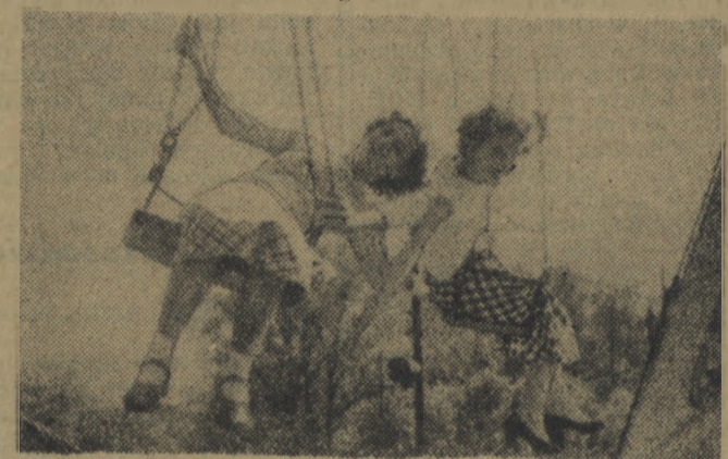
Na kartuzeli.