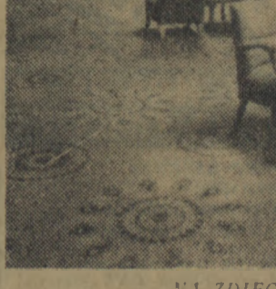
NA ZDJĘCIU: GŁOWNY HALL CAF