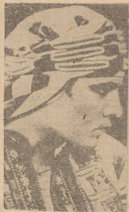
RUDOLF VALENTINO — najgłośniejszy amant w historii kina na już w piątek na ekranach telewizorów (na zdjęciu w filmie „Syn szelki” z 1926 r.)

my w cyklu Panorama kina radiotelewizyjnego Michała Kałatozowa „Dygnitarz na trawie” (1953), a obecnie zobaczymy — psychologiczny dramat wojenny.