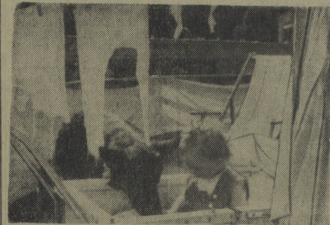
To nic, że nie ma przy mnie mamy, czuję się zupełnie bezpiecznie pod opieką mego czworonożnego przyjaciela...