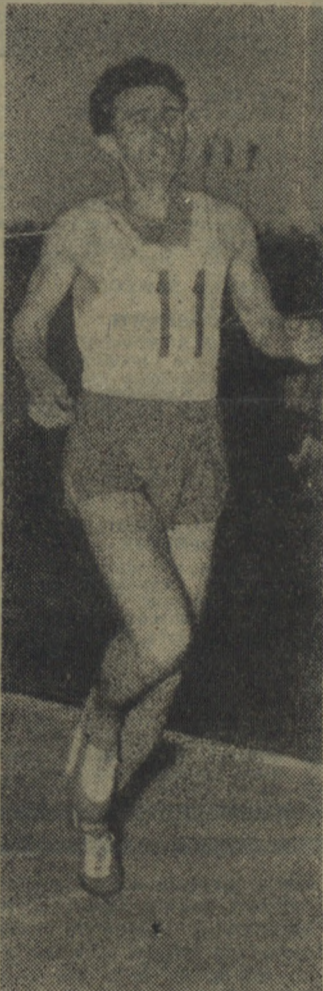
Na zdjęciu: Krzysztof Kusociński kończy zwycięsko bieg główny Memorialu na dystansie 3000 m.