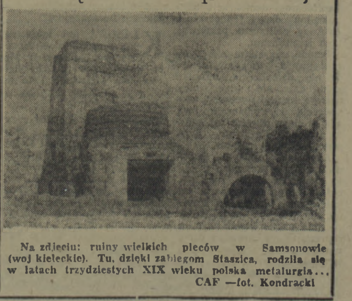
Na zdjęciu: ruiny wielkich pieców w Samsonowie (woj. kielecki). Tu, dzięki zabiegom Staszica, rodziła się w latach trzydziestych XIX wieku polska metalurgia...