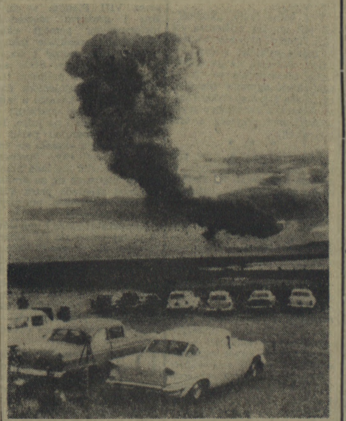
Na zdjęciu: wybuch bomby atomowej z serii obecnych prób amerykańskich w pobliżu Las Vegas (stan Nevada).