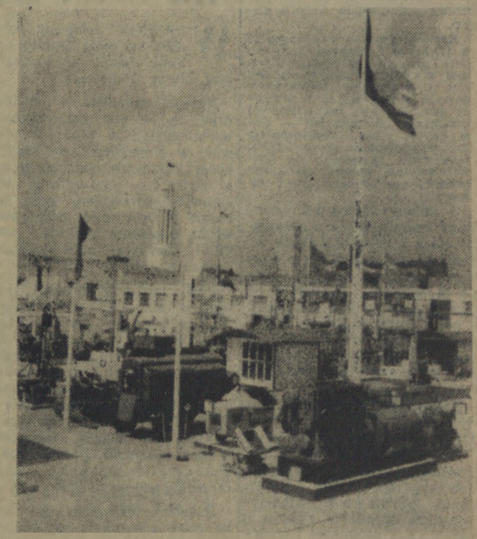
9 czerwca 1957 r. zostały otwarte XXVI Międzynarodowe Targi Poznańskie.

oklepnego z Kanady i USA, pro wadzili pertraktacje handlowe z „Minesem”. Rozmowy te, toczące się w bardzo kulturalnej atmosferze, przyniosły niezły wynik: podpisano dokument, który mówi o sprzedaży do obu tych krajów naszego szkła oklepnego za 55 tys. dolarów oraz kryształów, które przedstawiają łączną wartość 35 tys. dol.