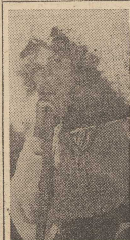
Dziwny jest ten świat...

inspektorzy wyegzekwowali na rzecz poszkodowanych ponad 11 mln zł. Wiele niedociągnięć stwierdzono też w terminowości i wysokości odszkodowań jednorazowych.