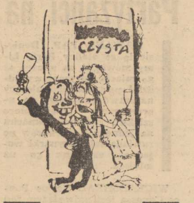
WODKA: — Ja was połączyłam i ja rozłączę...

W sprawie przestrzegania ustawy o wychowaniu w trzeźwości otrzymujemy sporo sygnałów od naszych Czytelników. Wielu twierdzi, że zakaz sprzedaży piwa przed godziną 13 był słuszny i niepotrzebnie go zniesiono. A jeżeli już — to trzeba było madrze ustalić