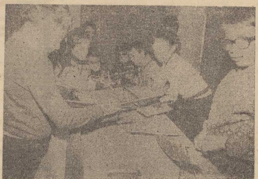
W MODELARNI Klubu Osiedlowego SM „Dąb” zawsze duży ruch.