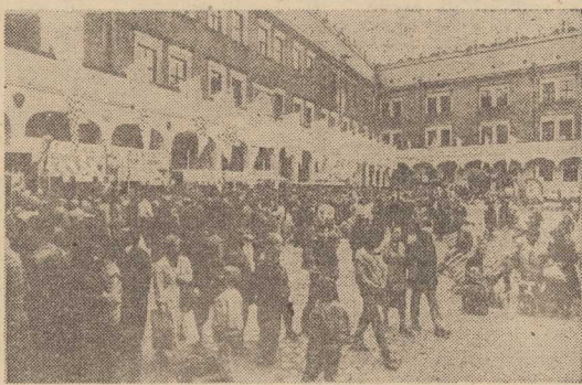
Tysiące szczecinian odwiedziły Zamek.

W trakcie sobotniej uroczystej sesji MRN i Rady Miejskiej PRON wręczone zostały także odznaczenia państwowe.