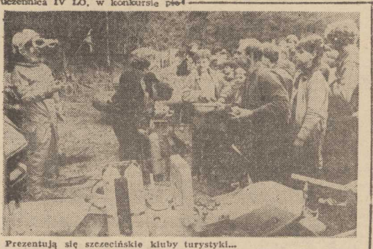
Prezentują się szczytyniejskie kluby turystyki...

Na zakończenie „Hejny!” — zaśpiewał pieśń „O ziemi ojcow...”