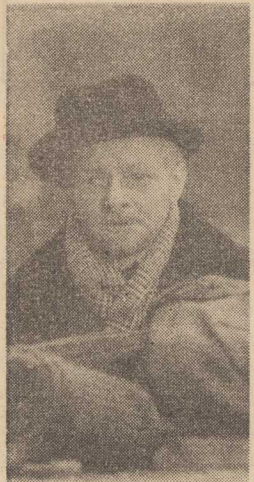
W ŚRODĘ zobaczymy program „Filmowe role Tadeusza Fijewskiego”, pr. II, godz. 22.45.