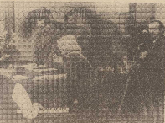
W CZWARTEK — polski film „Miłość ci wszystko wybaczę”. Na naszym zdjęciu — migawka z planu filmowego. Emisja o godz. 20.30 w pr. I.

„Wieczory szachowe” — komedia obyczajowa prod. czeskosłowackiej, opowiadająca o perypetiach czwórki bohaterów: czterdziestoletniego starego kawalera, jego matki zatapiającej za syna wszelkie sprawy, energicznego doktora Bauera i