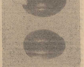
OTO dwa identyczne paciorki — u góry z naszyjnika współczesnego, na dole — woliniński sprzed 800 lat.