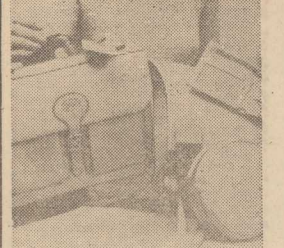
100 TYS. sztuk wyrobów (głównie z Juchtu) w 150 asortymentach dostają obecnie Zakład Galanterii Galanteryjny w Lublinie należący do Lubelskich Zakładów Przemysłu Skórzanego im. Mariana Buczka. 50 proc. wyrobów jest eksportowanych. Torby, torby podróżne, sportowe i inne trafają do wszystkich krajów socjalistycznych a także do RFN, Holandii, Szwajcarii (do znanej firmy Bree dyktatora mody w tej dziedzinie).