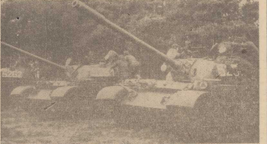
TRZEBA się spieszyć — tu procentują umiejętności nabyte w koszarach.