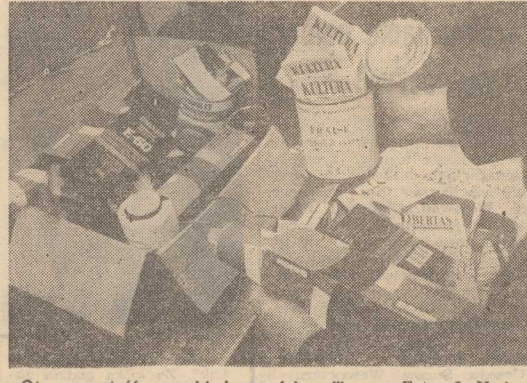
Oto zawartość „paczki żywnościowej”.

WCZORAJ w Świnoujściu na terenie należącym do Zarządu Portu Szczecin wybuchł pożar, którego bezpośrednią przyczyną była nieostrożność podczas wykonywania prac spawalniczych. Spłonęły dwa drewniane baraki typu „Namiów” użytkowane przez PZM i Zeglugę Szczecińska.