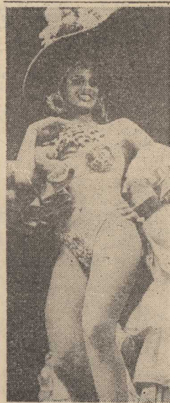
DZIS tradycyjny „śledzik”. Za kilka godzin zakończy się więc tegoroczny karnawał. Najchętniej obchodzą go — jak zawsze — w Rio de Janeiro.

TOKIO PAP. Na Filipinach wczoraj nasiliła się atmosfera wewnętrznego kryzysu po śmierci z broni palnej sympatka pani Aquino i rozejściu się w szereguch opozycji pogłosk o skierowaniu przez rząd do stolicy czolgów. Obarczony obowiązkiem podsumowania wyników elekcji i ogłoszenia zwycięzcy parlament, oczywiście kontrolowany przez obóz Marcosa, po 4-godzinnym posiedzeniu odroczył prace. (O sytuacji na Filipinach piszemy też na stronie 3).