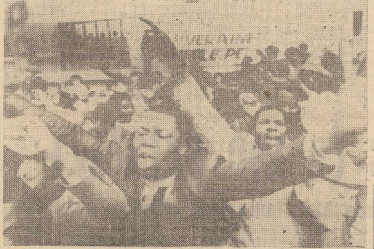
ZAMIESZKALI w Paryżu

PARYŻ PAP. Powieść mieszkancie francuskiej miejscowości Tourri, po powrocie do domu wszedł do sypialni i osłupiał na progu. Na jego łóżku siodło samotny tygrys. Śmiertelnie przerażony właściciel domu zdmknął drzwi na klucz i pobiegł na policję. Okazało się, że zwinął zbiegł z wędrownego cyrku. Do domu dotarł się przez nie domknięte okno. Przybył na miejsce postrzelone zapędził zbiega do klauki i odwieził do cyrku.