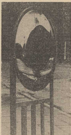
JAK doświadczenie uczy, łatwiej będzie teraz zdemontować całą konstrukcję, niż ustawić lustro. A przylatoby się na tym ruchliwym skrzyżowaniu (ulic Farnej i Korsarzy) noce.

drzewko. Tak więc osoby, które bez odpowiednich zezwoleń pozyskiwać będą w lasach choinki — staną przed Kolegium do Spraw Wykroczeń.