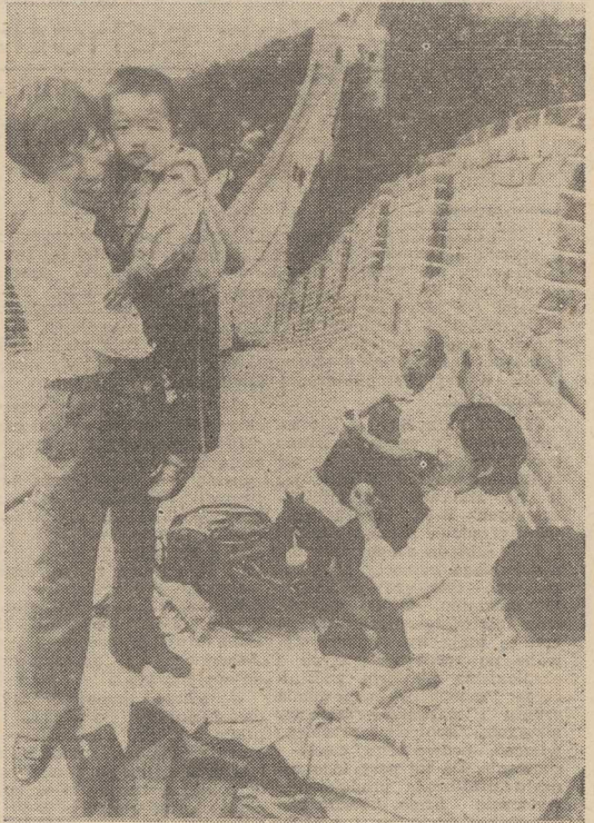
CHIŃSKI Wielki Mur został udostępniony do zwiedzania turystom. Jest tylko jedna trudność — aby wejść na górę trzeba pokonać 1100 stopni. Nic dziwnego, że po takim wysiłku apetyty dopisują...

Szybkim narastaniem napięcia na ziemiach pod zaborem zaniepokojony jest też rząd izraelski. We wtorek sytuację omawiała komisja obrony działająca w ramach parlamentu z udziałem ministra spraw zagranicznych Szimona Peresa. Jak podał radio izraelskie, Peres oświadczył, że ubolewa w powodu śmierci Palestyńczyków, niemniej jednoznacznie udzielił poparcia dotychczasowym działaniom wojska i policji.