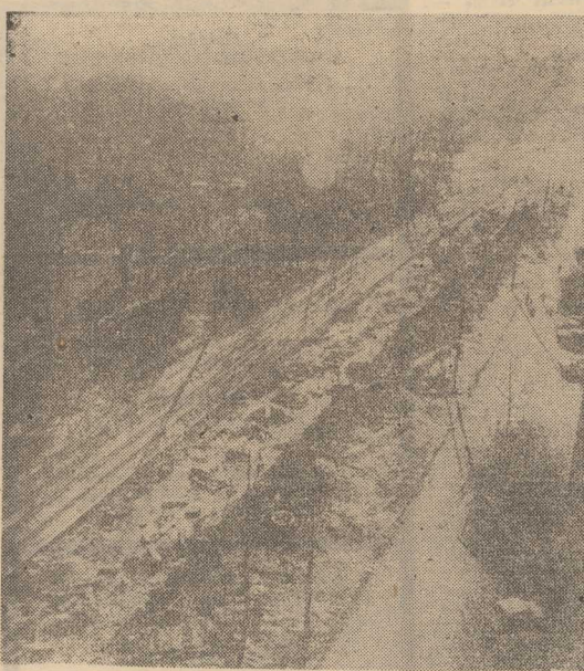
TRWAJA „wykopki” na budowie nowej, poszerzonej ul. Matejki. Brygady KPRI wkopują obecnie w ziemię — na głębokość 4 metrów — przewody kanalizacyjne. W Parku Zeromskiego natomiast (na odcinku między „Plantową” a ul. Zagmunda Starego) montowane są płyty chodnikowe. Piesi oddrożeni zostaną więc pasem zieleni od jezdni.

24 STYCZNIA przybłąkał się pies maści wilewskiej (mieszaniec). Wła-domości ul. Klemeniewicza nr 26/27 po godz. 16. 2 BM. przybłąkał się pies rasy do-berman, czarny, łapy podpalane. Władomości ul. Mazurska 21/39 po godz. 18. NA pl. Żołnierska znaleziono brzo-wąca rekawicę męską. Zgubie ode-brana, można w redakcji w pokoju nr 88.