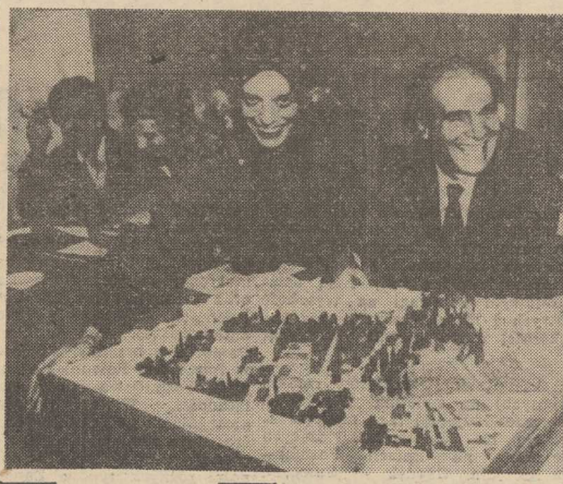
MINISTER Kultury Grejla pani Melina Marcouri pokazuje model obszaru leżącego u stóp Akropolu, gdzie stanąć ma nowe muzeum archeologiczne. Na projekt muzeum zostanie ogłoszony międzynarodowy konkurs, a zakończenie budowy przewidziane jest na 1996 rok.