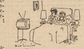
Przyznaj, że „Cztery pancerni i pies” za pośrednictwem telewizji satelitarnej to zupełnie co innego!

CO JAKIS CZAS TVP sięga do bogatej już skarbnicy pt. ARCHIWUM i wzmianca program powtórkami. Byli więc po raz któryś „Cztery pancerni”, jest obecnie „Janosik”, wędra nibawem „Przyłbie i kaptury” śmieszki ludzi Kabaretu Olgi Lipińskiej. A co o tym sądzi rysownik tygodnika „Antena”?