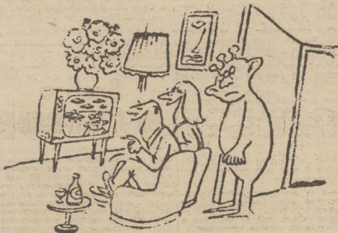
Popatrz, znowu będą te bzdury o latających talerzach.