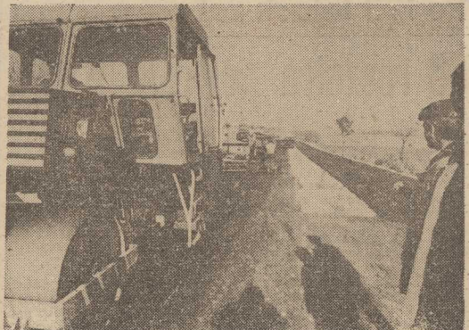
TRWA modernizacja trasy E-77 łączącej Warszawę z Gdańskiem. Roboty najbardziej zaawansowane są w rejonie Nidzicy i Ostródy (woj. olsztyńskie). Poszerza się tu pobocza i wykonuje pasy szybkiego ruchu. Do końca bieżącej pociągówki ma być już poszerzona cała trasa na Wybrzeże. NA ZDJĘCIU: trwają prace modernizacyjne drogi na odcinku Olsztynek — Ostróda.

A co dalej? Otóż początkowo, kiedy rozpoczynano budowę zakładano, że spółdzielnia zakończy na tym swoją działalność inwestycyjną. Dziś już wiadomo, że tak się nie stanie. Trwają przygotowania do budowy jeszcze jednego obiektu mieszkalnego na tym samym placu budowy.