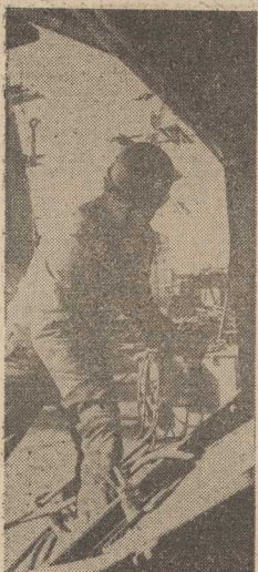
GDARSKA Stocznia Remontowa specjalizuje się w remontach statków rybackich: supertrawlerów B-608 i trawlerów przetwórci B-26. Do stajek jej kielonów należą armatorzy radzieccy. Obecnie przy nabrzeżach oraz w dokach stoczni znajduje się 18 jednostek bandery radzieckiej.

DZIŚ możemy z satysfakcją stwierdzić, że nasze obawy okazały się nieuzasadnione. Z satysfakcją oczywiście dla człon-