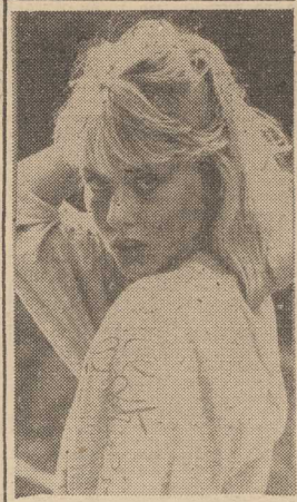
Panowie wołą blondynki!...

Urządzenie nowego kotwiczowiska poprzedzono kosztownymi, skomplikowanymi operacjami technicznymi. W czasie trawienia prowadzonego latem br. wydobyto m.in. kilkanaście dużych kotwic z łańcuchami, wśród nich jedną betonową o wadze blisko 20 ton, usunięto glazy wystające z morskiego dna, zasypano wyrwy powstałe w