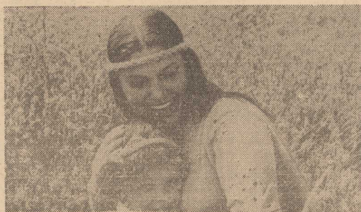
„Jelonek Bambi” poznaje świat”

jach II wojny światowej — rysowane typy — nie ma natomiast typowego gajdajowskiego stylu, mającego swój rodowód w klasycznej burlesce. Tym razem autor wyraźnie po- dąża w kierunku komedii re- fleksyjnej, zaś jego szamocący się bohater budzi skojarzenia z arcydziełem Cervantesa. Spar- tak Iwanowicz to współczesny rysowane typy — nie ma natomiast typowego gajdajowskiego stylu, mającego swój rodowód w klasycznej burlesce. Tym razem autor wyraźnie po- dąża w kierunku komedii re- fleksyjnej, zaś jego szamocący się bohater budzi skojarzenia z arcydziełem Cervantesa. Spar- tak Iwanowicz to współczesny