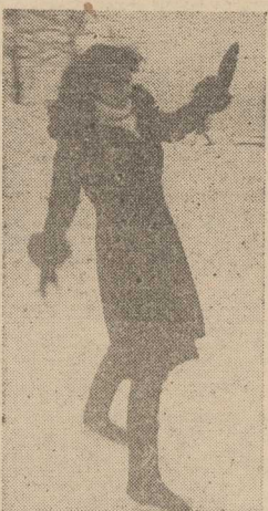
OSTROŻNIE — Ślisko! Nie wszędzie niestety chodniki są posypane piaskiem, zwłaszcza tam, gdzie trudno ustalić właściciela posesji...