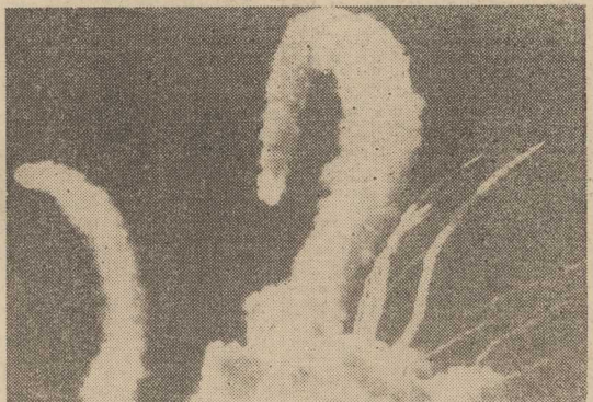
Wahadłowiec „Challenger” w chwilę po eksplozji.

nie zapowiadało. Pomiarzy prowadzone na bieżąco przez aparaturę telemetryczną, jak i rozmowy pilotów z naziemnym ośrodkiem kontroli lotu wskazywały, że start przebiega bez