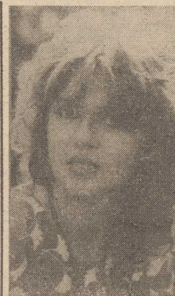
SŁOŃCE zamiast „rozjaśniania” włosów...

SPECJALISTI, stwierdzają, nie mają już prawie żadnych wątpliwości, że średnia temperatura na Ziemi w naj-