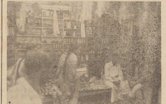
BOMBAJSKI sprzedawca wyznaje zasadę „nasz klient, nasz pan”. Wszystkie towary są łatwo dostępne dla kupującego.