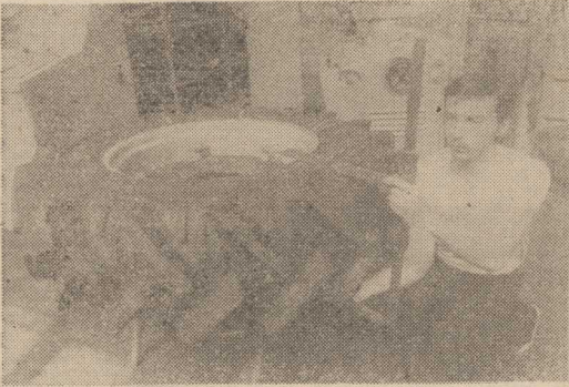
W ISTNIEJĄCYM od 1957 roku Ośrodku Badawczo-Rozwojowym Przemysłu Oponiarskiego „Stomil” w Poznaniu opracowano m. in. technologię produkcji opon dla nowej fabryki w Olsztynie, konstrukcję i technologię produkcji opon gumowych do średnicy ponad 15 m i detek dla Centralnej Wytwórni Detek w Deblu, a także urządzeń do wypełniania opon elastomerem poliuretanowym. Ostatnio trwają tu badania nad technologią produkcji opon radialnych przeznaczonych dla ciągników. Prace prowadzone są nad zewnętrznymi rozmiarami opon. Opracowanie idzie w parze z rozpoczęciem rozbudowy nowego wydziału opon radialnych fabryki w Olsztynie. NA ZDJĘCIU: pomiary opony radijalnej rolniczej po badaniach.