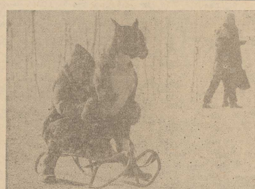
POPADAŁO trochę śniegu o najmłodszy już wyruszyli z sarniczkami na pobliskie góry.