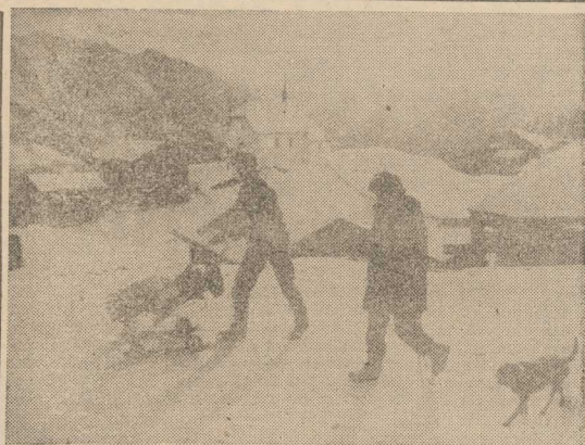
Zima w szwajcarskich Alpach.