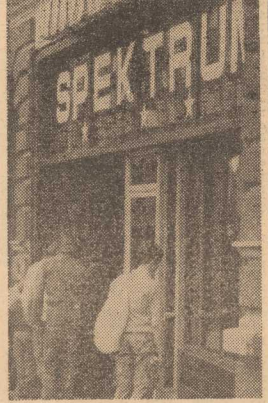
PRZYBYWA coraz więcej sklepów z komputerami.

1080 PLOT x-15, 117;DRAW 15, —15;DRAW 15, 15.