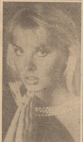
...i jeszcze trochę słońca.

WARSZAWA PAP. Biuro Polityczne KC PZPR zapomniało się 23 bm. z projektem Narodowego Planu Społeczno-Gospodarczego na lata 1986-1990, którego głównym kierunkiem zaplanowano X Zjazd partii. Podkreślono wagę zdecydowanych działań szczególnie na rzecz realizacji drugiego etapu reformy oraz równoważenia gospodarki. Rozpatrzono informację o sytuacji samorządu założeń, wskaźnikach na zadania partii w jego rozwoju i umacnianiu. Omówiono stan przygotowań do roku akademickiego 1986/87.