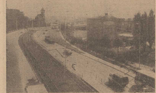
Ulica Energetyków widziana z estakady Trasy Zamkowej.

KROTOKO przed północą w Dziwnowie wybuchł pożar w domu wesołym „późnoludzkim” „Stomilum”. Spaliło się 138 korder, 100 poduszki, 60 odbiorników radiowych i inne przedmioty złożone w magazynie. Przyczyną pożaru na razie nie ustalono. (ap)