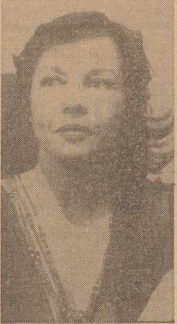
W „NIEDOSTĘPNEJ” Krzysztofa Zanussiego zobaczymy Leslie Caron.