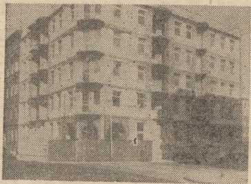
Powstające „plomb” nawiązują do istniejącej zabudowy...

prostu cude — mówi prezes Tomasz Chudeczek. Budynek mieszkalny, tak zwana plomba, przy ulicy Królowej Jadwigi 20 wznosi MSM „Portowiec”. Wszystkie prace, w miarę możliwości, starają się wykonać przyszli mieszkańcy. Przy obecnych cenach materia-