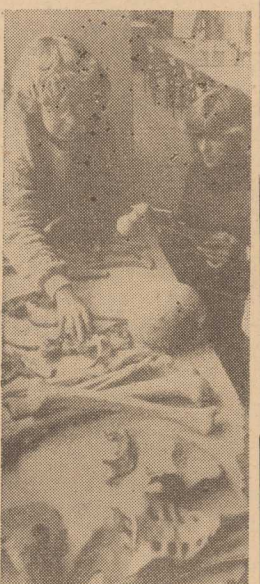
W LEKNIE (woj. płskie) już 5 sezon działła ekspedycja archeologiczna Instytutu Historii UAM w Poznaniu...