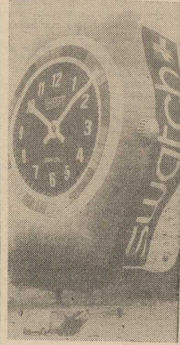
TRZY takie balony-zegary będą fruwać w tym roku nad wyspami japońskimi. W ten sposób Szwajcarzy chcą bardziej eksportować swój tradycyjny rozklatmawiaczowy tradycyjnny eksportowy towar.

(Dokończenie ze str. 1) z toalet damskich i męskich. Na drugim miejscu znalazła się hollywoodzka aktorka Joan Collins, a na trzecim miejscu niezwykle ostatnio modna piosenkarka rockowa Madonna. Na dalszych miejscach znalazły się piosenkarka Tina Turner oraz aktorki Michele Lee, Whoopi Goldberg, Cybil Sheperd, Lisa Hartman, Apollonia i Heather Thomas. Warto zaznaczyć, że w gronie po wsze czasy zdyskwalifikowanych przez Blackwella pań za brak gustu w ubiorze figurują Elizabeth Taylor, Barbra Streisand, Charlene Tilton i piosenkarka Cher. JEDNOCZEŚNIE Blackwell ogłosił nazwiska dziesięciu kobiet, ubierających się — jego zdaniem — najbardziej niezależnie, a przy tym mających własny styl. Na tej liście znalazły się Raisa Gorbaczow i Nancy Reagan, poprzednia żona