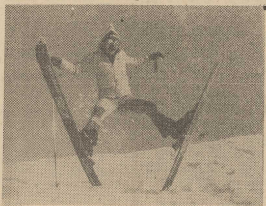
U NAS pogoda typowo szczecińska, a w górach — zima i do bre warunki do uprawiania „białego szaleństwa”.