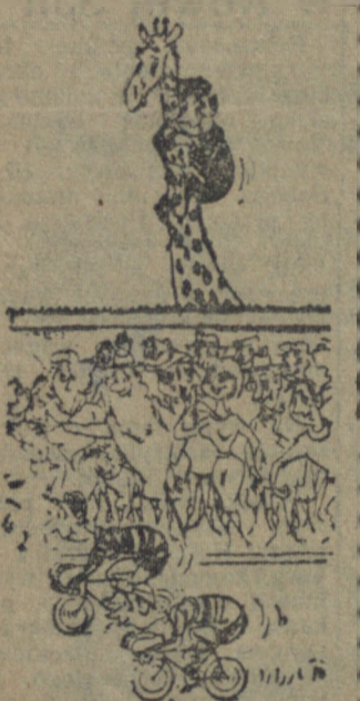
Jak to dobrze, że dyrektor ZOO skierował umię do obsługi zryta!