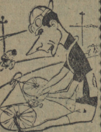
I to ma być WYŚCIG POKOJU — cały czas WÓJNA z rowerem