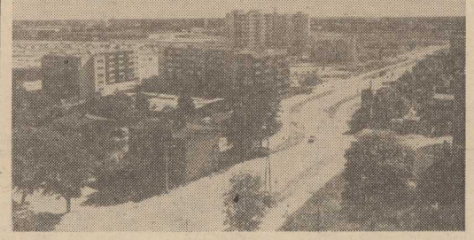
NAJNOWSZA dzielnica na prawobrzeżu — Majowe.

zastępca kierownika baru. Staramy się zawsze być na bieżąco z daną porą roku. Teraz na przykład w naszych zestawach proponujemy nowalijki, zupy od chłodników po grochówkę, drugie dania z młodymi ziemniakami i bogate zestawy surowek. Głodny więc i niezadowolony od nas nikt nie wyjdzie. (Jacz)