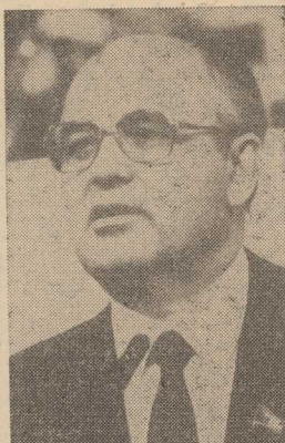
NA ZDJĘCIU: przemawia Sekretarz Generalny KC KPZR Michaił Gorbaczow.

W tej ogólnej strategii dobrze wpisuje się również rozwijające się intensywnie kontakty radziecko-polskie. Życie nakazuje aktywniejsze wdrażanie nowych najbardziej perspektywicznych form współpracy. Naszej delegacji sprawiło satysfakcję, kiedy dowiedzieli się o wystąpieniu na waszym Zjeździe, że już pierwsze posunięcia uczynio-