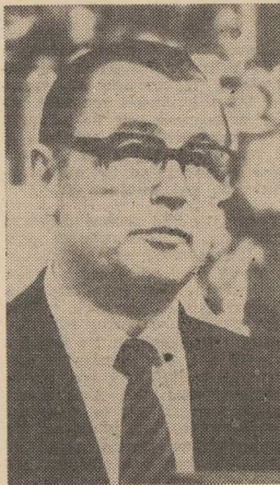
NA ZDJĘCIU: przemawia premier Zbigniew Messner.

● RZĄD kieruje spotęgowanym wysiłkiem we wszechstronne przeciwdziałanie przyczynom inflacji. Temu ma służyć m. in. program oszczędnościowy, zmiana w polityce inwestycyjnej, doskonalenie mechanizmów tworzenia plac i dochodów przedsiębiorstw, polityka podatkowa, poprawa organizacji pracy.