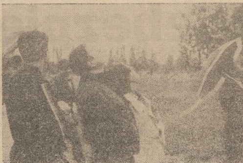
Deszcz nie przeszkadzał w podziwianiu akrobacji.

TAK się złożyło, że sukces ten zbliżył się do dwudniową km. preza na lotnisku Aeroklubu Szczecińskiego w Dąbiu, propagująca wszystkie dyscypliny lotnictwa sportowego i gospodarczego. Wiele osób miało więc okazję zobaczyć z bliska jak wygląda „Wilga”, na której tak mistrzowsko latają Polacy. Oglądano też nie tylko samoloty, ale i szybowce, śmigłowce, piękne modele sprzętu latającego. Członkowie Aero klubu zaprezentowali także