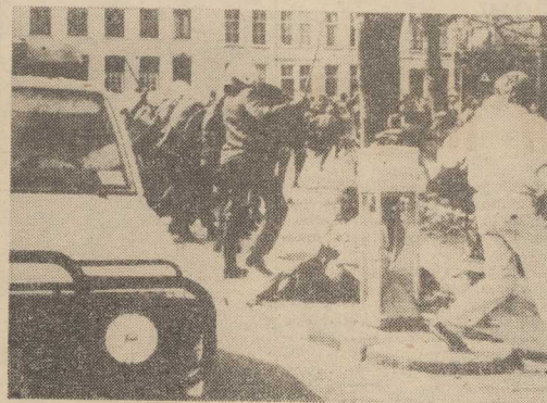
12 BM. podczas wzięty papięta Jana Pawła II w holenderskiej miejscowości. Utrecht odbyła się demonstracja antyppapieża z udziałem ok. 3000 osób. Interwencjonowała policja.