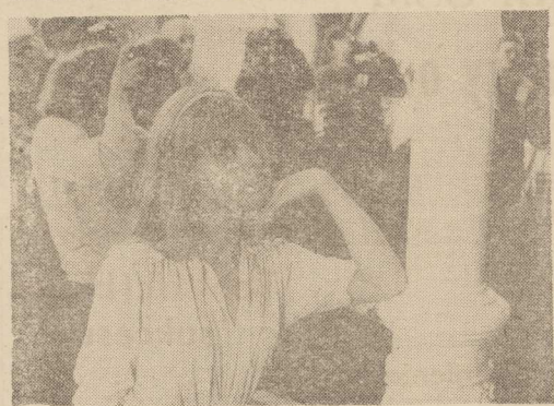
W KONCU maja — wybory Miss Polonia 83. TVP obiecuje nieco szersze niż do tej pory relacje. Na naszym zdjęciu — jedna z kandydatek w konkursie z 1983 r.

znani wykonawcy... Występują m.in. Dirk Bogarde, Jacqueline Sassard, Michael York, Delphine Seyrig. Autorem ilustracji muzycznej jest — podobnie jak w przypadku uwiecznianego w ub. piątek „Służące-