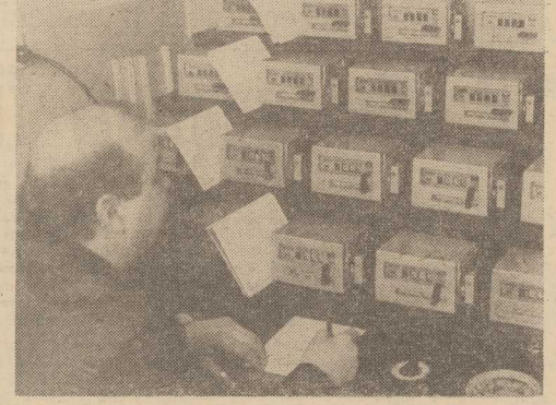
POZNAŃSKIE PRZEDSIĘBIORSTWO Aparatury i Urządzeń Komunalnych „Powogaz” planuje w tym roku poważnie zwiększyć eksport. Do 20 państw trafia wodomierze i chloratory przemysłowe wartości 0,5 mln dolarów i ok. 6 mln rubli. „Powogaz” jest też największym w kraju producentem poszukiwanych taksometrów mechaniczno-elektronicznych. Wszystkie urządzenia tu wytwarzane są systematycznie modernizowane, z ich zbytem nie ma więc problemów. NA ZDJĘCIU: w stacji prób taksometrów.