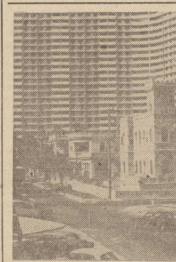
HAWANA. Stare i nowe.

PRAGA PAP. Ogromną popularnością w CSRS cieszy się bezalkoholowe piwo „Pils”. Wskutek wielkiego popytu na ten napój browar w Prostějovie zwiększył produkcję piwa „Pils” do 40 tys. butelek miesięcznie. Obecnie czeskośćwojący kierownicy mogą gadać pragnienie tym kalkulem nieszkodliwym napojem.