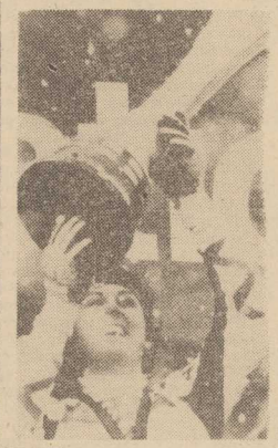
MICHAELA FIGINI prezentuje Puchar Narodów, który zdobyła wraz z koleżankami i kolegami z ekipy szwajcarskiej za zwycięstwo w nariarskim Pucharze Świata. Figini zdobyła punktów najwięcej, gdyż triumfowała w pucharowej rywalizacji łącznej oraz w szalowej — gigantycznej i zjeździe.

JUTRO o godz. 15.30 w hali PAM przy ul. Dunkowskiej rozpocznie się trzydniowy turniej koszykówki o prawo gry w II lidze Szczecińskiej. W półfinałach będą rozgrywane w kategorii kobiet i mężczyzn w trzech dzielnicach zespoły uzyskują awans do finału. Wśród kobiet ujrzymy 4 drużyny: AZS