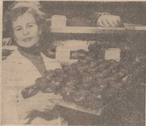
Cukiernicy pieką 260 tys. pączków