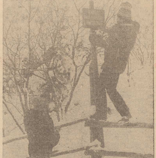
PRZED SEZONEM ZIMOWYM ratownicy w Grupy Tratrzańkiej GOPR w Zakopanem ustawiali w całym Tratrach tablice ostrzegające przed lawinami. Znajdują się one w miejscach najbardziej zagrożonych oraz przed najpopularniejszymi szlakami turystycznymi i trasami narciarskimi. NA ZDJĘCIU: podczas ustawiania tablic ostrzegających przed ratowników GOPR-u.

— PANIE dyrektorze. Ostatnimi czasy wszedł pan w kontakt z rzemiosłem. Na obiekty remontowane przez Pana wkraczają rzemieślnicy. Remonty nie trwają już przyswojone wieki. A mimo to w tym roku nie był pan w stanie przebrać 300 mln zł przeznaczonych na remonty kapitalne.