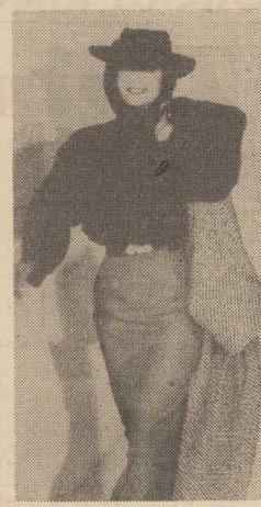
WĘGIERSKA kolekcja mody na przyszły sezon.

PEKIN PAP. Gazety chińskie informują o powrocie do Pekinu chińskiej ekspedycji antarktycznej, która pracowała na stacji „Wielki mur”, położonej na wyspie King George. Obecnie na lodowym kontynencie prowadzi badania i obserwacje druga grupa chińska na ukłoków licząca około 40 osób. Członkowie ekspedycji zdobyli do świadczenia dla niezbędnych działań badań nad warunkami naturalnymi lodowego kontynentu. Budowę chińskiej stacji antarktycznej ukończono w lutym b.