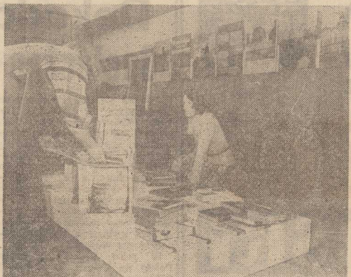
PRACOWNICE Książnicy Szczecińskiej przygotowują wystawę piśmiennictwa z lat 1945-1985 poświęconego Ziemiom Zachodnim i Północnym.