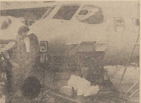
W WYTWORNI SPRZETU KOMUNIKACYJNEGO w Mielcu trwała budowa serii informacyjnej samolotów AN 28. Nowy samolot produkowany w oparciu o licencję radziecką przeznaczony jest do przewozu pasażerów (17 osób), towarów i poczty na lokalnych liniach powiatowych, w tym również z matych lotnisk gruntowych. AN 28 wyposażony jest w dwa silniki turbopropellerowe, sprężarki powietrzne i pilotowo-nawigacyjny zabezpieczający wykonywanie lotów w trudnych warunkach meteorologicznych w dzień i w nocy. Na zdjęciu: samoloty w hali montażowej.