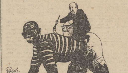
Pisak Kosmetyka apartheidu "Die Weltwoche"/Szwajcaria/

Autoryzacja podkreśla, że jednym z warunków zalecenia leku przeciw chorobie o takim zasięgu jest prowadzenie eksperymentów laboratoryjnych z doświadczalnymi zwierzętami polegających m. in. na zarażeniu ich wirusem AIDS, celem określenia okresu inkubacji tej choroby.