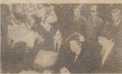
Immatrykulacja studentów Uniwersytetu Szczecińskiego.

W oparciu o zebrane materiały prokuratury rejonowej w Biłogostoku umorzono śledztwo wobec nieświadomości przestępstwa