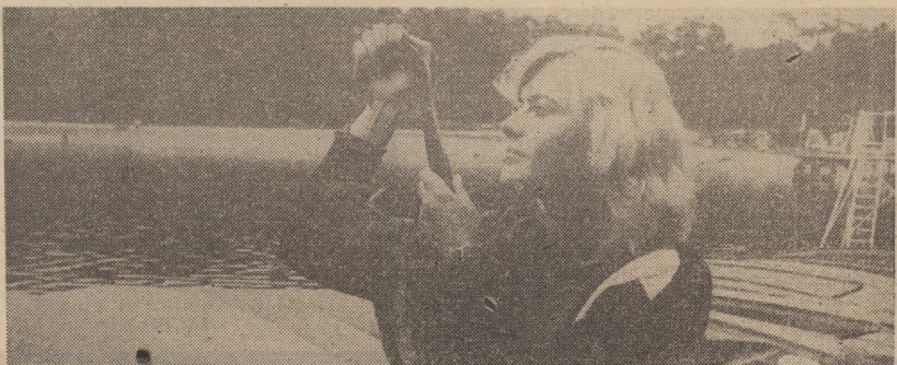
Plaże coraz biedniejsze a więc latem...