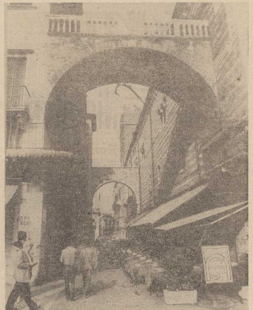
WERONA — jedno z najpiękniejszych miast północnych Włoch. Stawne dzięki szekspirowskim kochankom — i rycerskim tradycjom. CAF—Zbraniecki

Prezydent de la Madrid zobowiązał odpowiedzialnych ministrów do zrewidowania prawa budowlanego.