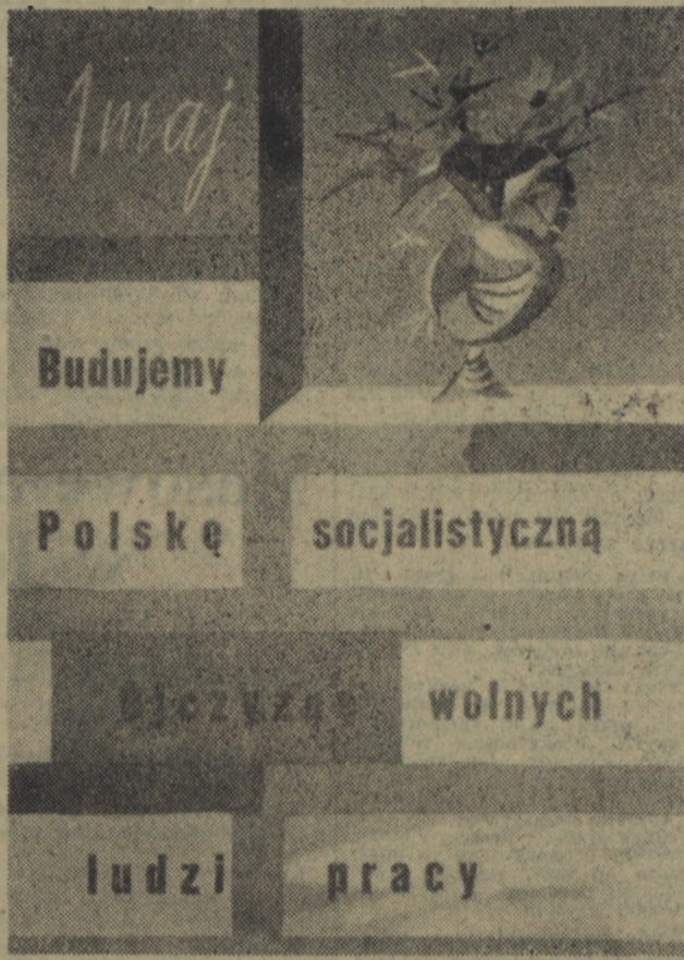
Na zdjęciu: plakat 1-Majowy wg. projektu Henryka Tomaszewskiego.