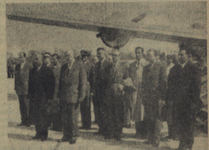
Na zdjęciu: powitanie na lotnisku Okęcie w Warszawie.

Minister „obrony” Korei Południowej Kim Jong Woo przy lekkin karabinie maszynowym podczas swej wizyty w Et. Benning w stanie Georgia (USA), gdzie zstana jomił się ze szkoleniem i bronią piechoty amerykańskiej.