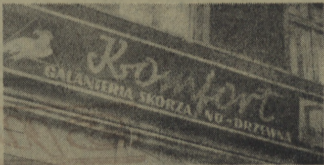
Taki oto szklid wisł nad sklepem przy ul. 1 Maja.