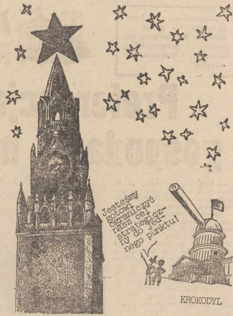
Jesteśmy gotowi obronić nasz cel strategiczny do każdego punktu!

RZYM PAP. W czasie, gdy astronomowie prowadzą stale obserwacje zbliżającej się do Ziemi komety Halleya, historycy sztuki również nie są bezczynni. Tak np. ustalił onl. że artysta malarz z Florencji Giotto di Bondone (1266-1337 r.), był pierwszym w Europie, który naszkicował „portret” słynnej komety. Przedstawiona jest ona na jego fresku „Pokłon trzech królów” w jednej z kaplic Padwy. Fresk pochodzi z okresu 1303-1304 roku. Według obliczeń astronomów kometa Halleya przeszła w pobliżu Ziemi w 1301 roku.