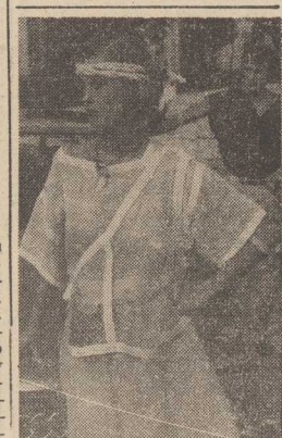
Kobieta fantazja nie ma granic.

LIZBONA PAP. Koło Viseu w północnej części Portugalii doszło wczoraj wieczorem do poważnej katastrofy kolejowej. Nastąpiło tam zderzenie pociągu międzynarodowego pociągu ekspresowego, który jechał do Francji, z pociągiem lokalnym. Dziś rano podano w Lizbonie, że — według wstępnych danych — śmierć poniosło 150 osób, a 150 zostało rannych. Akcja ratownicza trwa. Na miejscu katastrofy przybył premier Portugalii Mario Soares. Rząd portugalski ogłosił w całym kraju 3 dni żałoby.