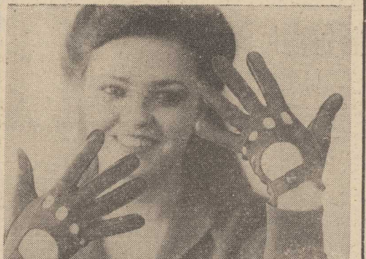
FABRYKA Rękawiczek i Odzież Skórzanej w Miastku (woj. śląskie) produkuje wiele interesujących — zwłaszcza dla pań — rzeczy. Prawdziwym przebojem są skórzane spodnie a także płaszcz damskie z czarnej skóry, koszułe z łzu, wełnu i wlnianego oraz ciagle modne i poszukiwane rękawiczki — jak choćby te „samochodowe”, które prezentujemy na zdjęciu.